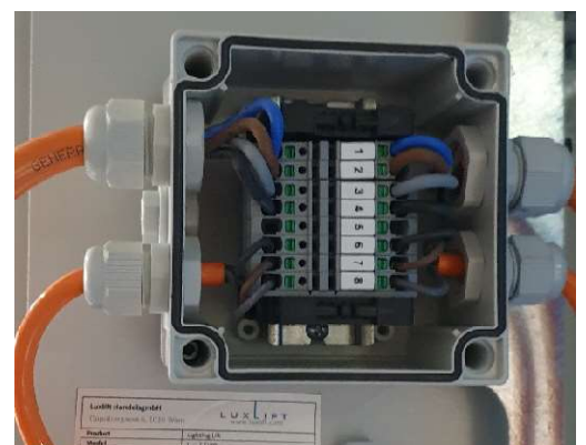
einfache elektrische Verkabelung