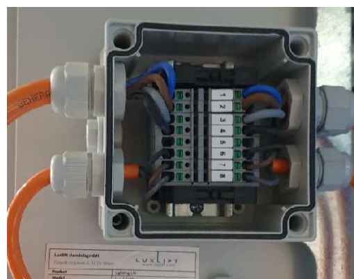
Jednoduché elektrické zapojenie

Spoločnosť Luxlift HandelsgmbH si vyhradzuje právo na zmeny technických údajov bez predchádzajúceho upozornenia. Spoločnosť Luxlift HandelsgmbH nenesie žiadnu zodpovednosť za tlačové a typografické chyby. Z informácií uvedených v tomto technickom liste nemožno vyvodzovať žiadne nároky.