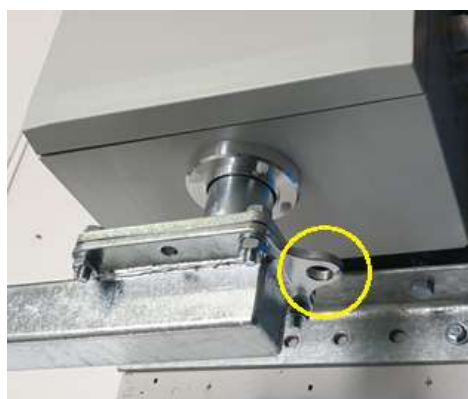
Pripojenie na zem cez Skrutka M16