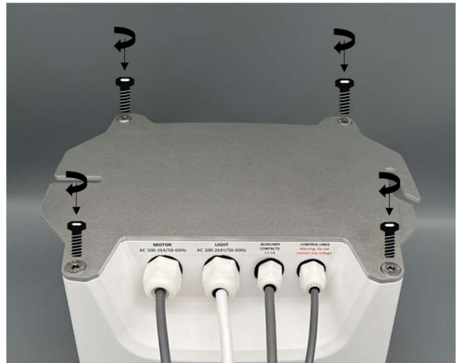
Ceiling attachment Deckenbefestigung

Verschieben Sie die Platte bis beide Befestigungspunkte ca. in der Mitte der Öffnungen positioniert sind. Vergewissern Sie sich, dass der Lift waagrecht hängt und schrauben Sie die Befestigungspunkte fest.