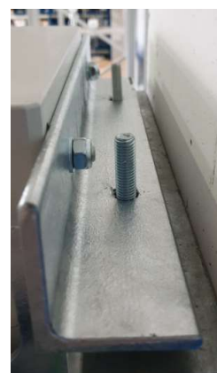
Detalj gornjeg nosača za montažu