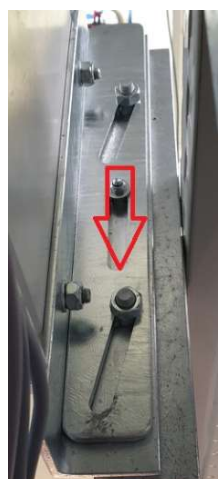
Kompenzacija kuta na donjem nosaču za montažu